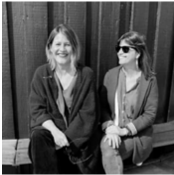
The Room & Co